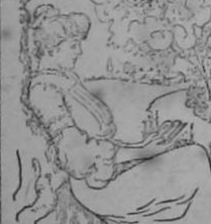
(Para la señora q. está entristecida porque le parezca imposible ser madre.)