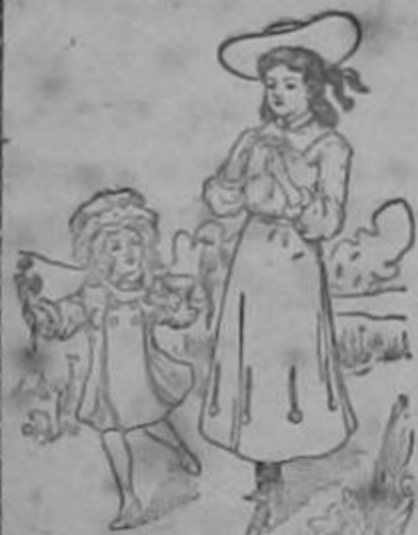
(Para las niñas q. comienzan a cuidar el estado de su hijo)