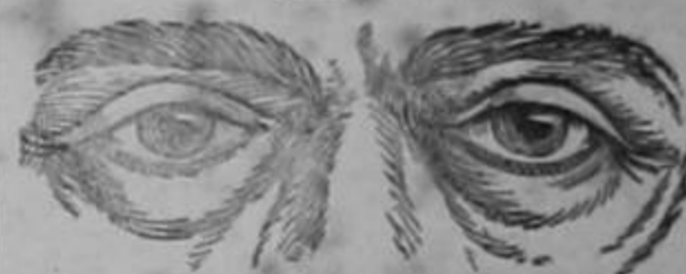
Recrecimientos debajo de los ojos y en las pantorrillas, piernas, brazos y abdomen. Significan hidropea.

La congestión o inflamación de los riñones causa generalmente un dolor palpitante por detrás en la cintura, punzadas al empinarse o agacharse, dolor de espalda, luego es casi seguro que se desorganice la acción de los riñones y cause frecuentes orines, aunque sean pocos a la vez; se siente ardor y dolores, pesantez y los orines parecen fangosos, con sedimentos y de color obscuro. Cuando se interrumpe la circulación de la sangre, o se atrasa en parte, a causa de la inflamación de cualquier riñón, las sustancias tóxicas y venenosas el ácido úrico especialmente se acumulan en la sangre, y se hace imposible una buena salud. Con el tiempo el ácido úrico endurece las arterias, retrasa la circulación de la sangre y causa la hidropea, (véanse los síntomas en el grabado) arenilla, piedra y otros graves males que pueden traer muy malas consecuencias.