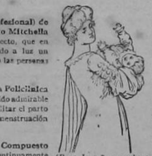
(Para la señora embarazada y para la madre q. está criando.)

NOTA: Si estas son sus cualidades esenciales, ¿por qué no queda Ud. convencida como otras señoras y señoritas que han sentido sus beneficios, al Vd. también puede hacerlo como las demás? Además, es un remedio que tiene la propiedad de prevenir las enfermedades del sexo, antes que ellas puedan desarrollarse, combatiéndolas victoriosamente. Las señoras no deben olvidar que el Compuesto Mitchella, es un remedio inofensivo que propicia el feliz advenimiento del ser que aspiran las madres. No solamente contribuye al rápido y absoluto restablecimiento después del parto, sino que proporciona a la madre ponerla en condiciones de amamantar su niño ofreciéndole abundante alimento de su pecho. Comience cuanto antes la primera prueba y observe los resultados. Es de sustancias vegetales y absolutamente inofensivas. Pídalo en las Boticas y Droguerías e insista en que el Sr. Boticario le dé el Compuesto Mitchella. DR. J. H. DYE MEDICAL INSTITUTE, Buffalo, N. Y., E. U. de A.