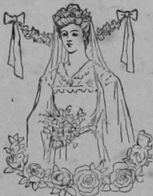
(Para las jóvenes débiles, nerviosas o demacradas.)